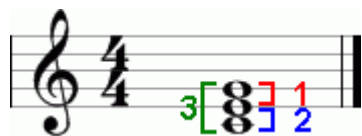
Рисунок 1. 1-малая терция, 2-большая терция, 3-чистая квинта.